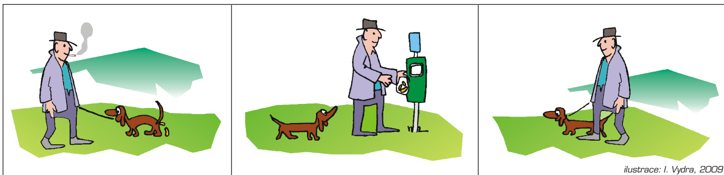
ilustrace: I. Vydra, 2009